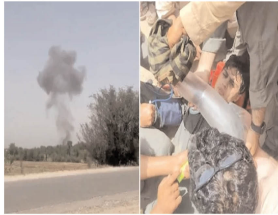
సోషల్ మీడియాలో వైరల్ అవుతోంది. సాంకేతిక లోపం

పాకిస్థాన్ ఎయిర్ ఫోర్స్ కు చెందిన జేఎఫ్-17 యుద్ధ విమానం కుప్పకూలింది. చైనా సహాయంతో తయారు చేసిన ఈ జేఎఫ్-17 థండర్ ఫైటర్ జెట్లను పాక్ ఎయిర్ ఫోర్స్ వినియోగిస్తోంది. తాజాగా తమ పైలట్లకు పాక్ ఎయిర్ ఫోర్స్ శిక్షణ ఇస్తున్న సమయంలో ఇది కుప్పకూలింది. ఈ ఘటన పాకిస్థాన్ లోని కర్రూ ప్రాంతంలో జరిగినట్లు వార్తలు వచ్చాయి. విమానంలో ఉన్న ఇద్దరు పైలట్లు ప్రమాదానికి ముందే సురక్షితంగా బయటపడినట్లు సమాచారం. అయితే వారికి గాయాలయ్యాయని స్థానిక మీడియా తెలిపింది. ఘటనలో పౌరులకు ఎలాంటి నష్టం జరగలేదని అధికారులు వెల్లడించారు. ఈ ప్రమాదానికి సంబంధించిన మీడియా